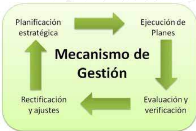
Figura 3: Mecanismo de Gestión

El proceso de gestión que se sugiere usar para la implementación de este plan es un modelo basado en el “Círculo de Deming” (de Edward Deming). Este modelo funciona a través de cuatro etapas o procesos sucesivos y cíclicos: planificación estratégica; ejecución de actividades; evaluación y verificación; y, rectificación y ajustes.